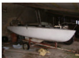
Cap-Corse à terminer

Annnonce CC 060101 A VENDRE, Coque Cap Corse en polyester, neuve nue, aménagements, pont roof, à terminer. Avec la coque sera remis le lest, la dérive, le safran et le balcon. Visible à Mortagne au Perche (61). Prix à débattre 2500€, contact Association A. de Poix